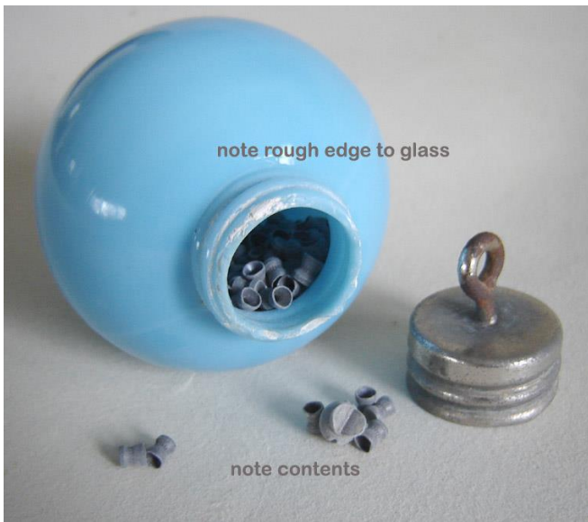
6134976029 Canada Victorian ☺