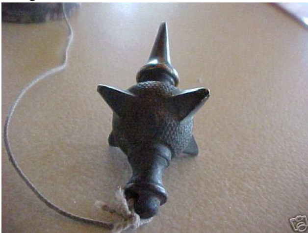
220045673069 Schnupftabakdose mit Löffel

Noch einige aus den letzten 20 Jahren von Ebay: Morgenstern?