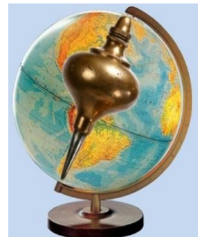
Logo of the International Plumb Bob Collectors Association IPBCA

Ps. Für uns dreht sich die ganze Welt um das Senklot, wie aus dem Logo ersichtlich ist. ☺