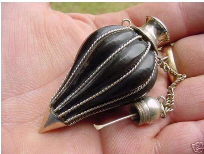
6267593930 Senklot aus Nagel